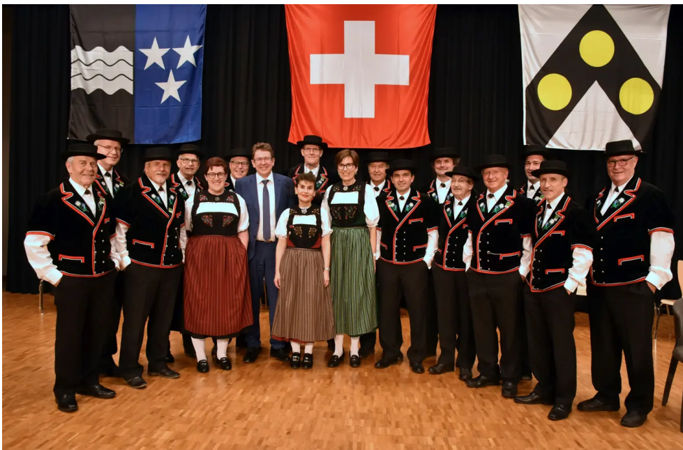
Gruppenbild mit Bundesrat: Albert Rösti posiert für ein Foto mit dem Jodlerclub Kölliken.

Ohnehin hat Rösti in Holziken ein Heimspiel, der Stargast posiert für viele Selfies, gibt Autogramme, schüttelt Hände und posiert mit dem Jodlerclub Kölliken für ein Foto. Dieser singt eigens für den Bundesrat, der im Berner Oberland zu Hause ist, das Lied «Am Thunersee». Das freut Rösti sehr und so verzeihen ihm die SVPLer den Fauxpas, den er sich leistet: «Eine grössere Ehre als dieses Lied könnte mir hier im Thurgau nicht zuteilwerden.»